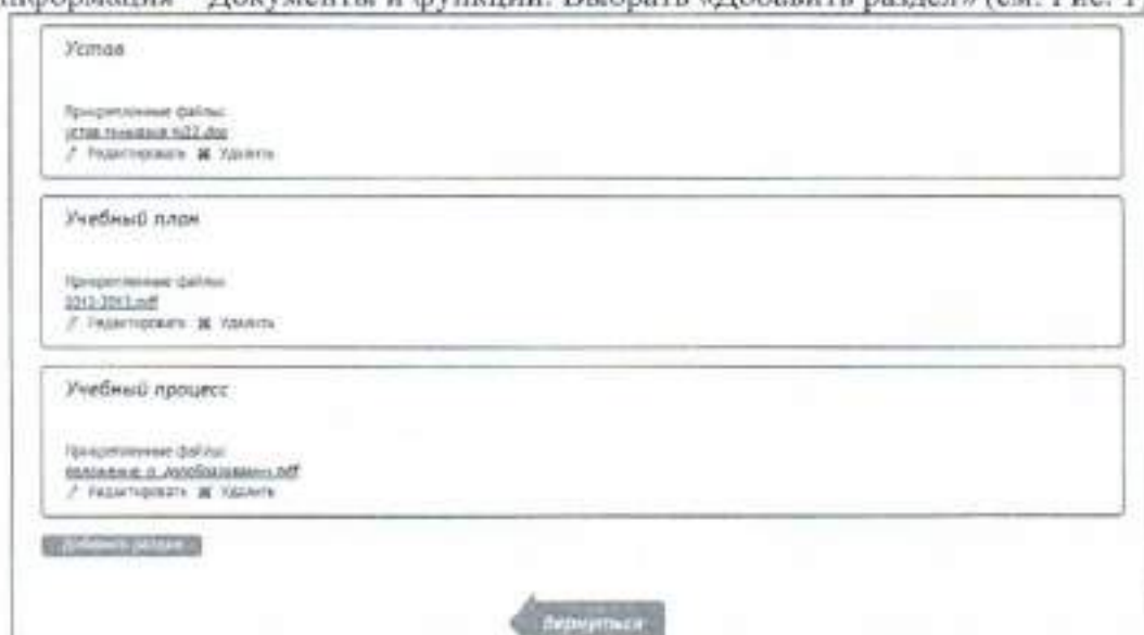
Рис. 1. Добавление нового раздела.

1. На странице школы перейти в Редактировать данные – Общая информация – Документы и функции. Выбрать «Добавить раздел» (см. Рис. 1)